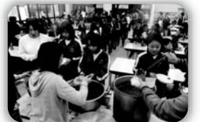
お父さんと生徒たちによる 手作りカレーライスだよ!!

まず最初に家庭科室で生徒とお父さん達でカレー作りをしました。みんなで協力して作って作る事ができ、生徒達の笑顔がたくさん見られました。一方、普段料理を作っていないお母さん達は体育館で十月に行った野外活動のビデオ鑑賞をしました。