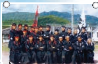
今年もカッパ良かったです