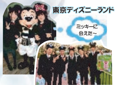
ミッキーに 会えた～

見るより何倍も役に立つのを見分ける経験するものが自分を引き上げてくれるものかどうかを知る上で、大学訪問は非常に有意義なものだとわかりました。そして何より、自分の将来を見つめる良い機会になったと思います。