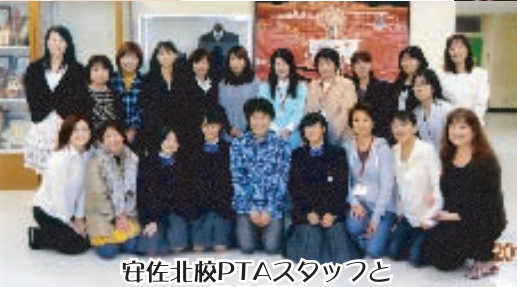
安佐北校PTAスタッフと 記念撮影