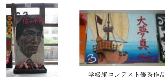
看板コンテスト優秀作品