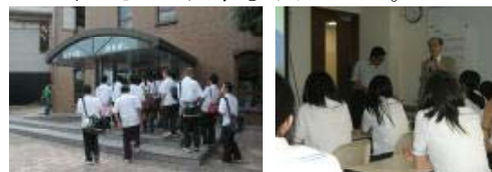
広島大学教育学部

学部長あるいは入試担当者から、大学の紹介、入学試験などの説明を受けました。現在、大学に在籍している本校卒業生からの説明等を配慮して下さった大学もありました。